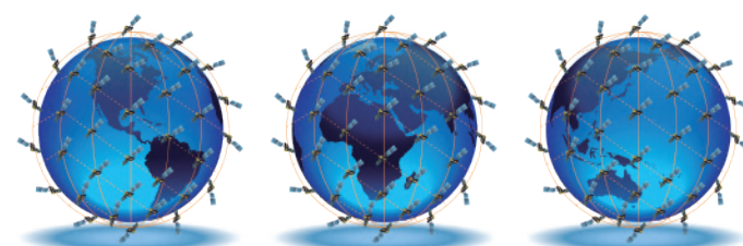
MAPA DE COBERTURA DE IRIDIUM